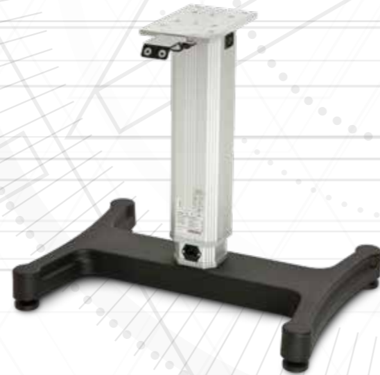
Table with steel base with ABS covering, with electric elevation on which apply any model of table top.

Tavolo con base in acciaio con copertura in ABS, con sollevamento elettrico sul quale applicare qualsiasi piano tavola.