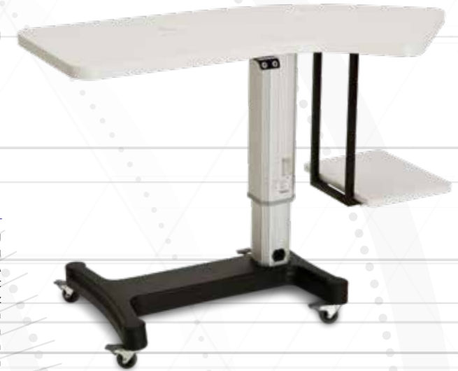
Table with steel base with ABS covering, electric raising with shoped table top and printer support.

Tavolo con base in acciaio con copertura in ABS, con sollevamento elettrico con piano tavolo sagomato e supporto per stampare.