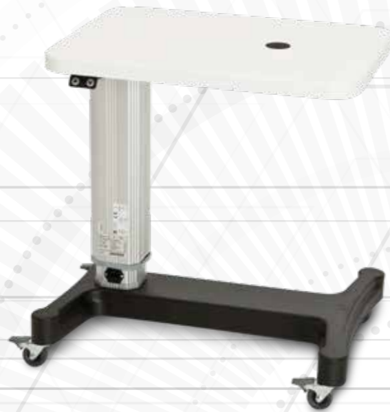
Table with steel base with ABS covering, with electric elevation on which is applied a lacquered table top.

Tavolo con base in acciaio con copertura in ABS, con sollevamento elettrico sul quale è applicato un piano tavola laccato.