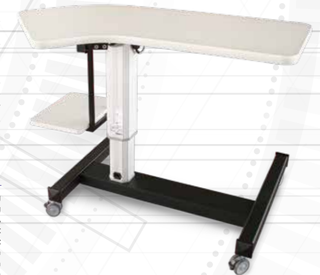
Table with steel base suitable for wheelchair with ABS covering, electric raising with actuator, shoped table top, with printer support, with LED illumination under the table top, electric sockets to connect the various instruments.

Tavolo con base in acciaio adatta per poltrone a rotelle con copertura in ABS, sollevamento con attuatore elettrico, piano tavola sagomato, con supporto stampante, con illuminazione LED sotto il piano tavola e prese elettriche per connettersi con i vari strumenti.